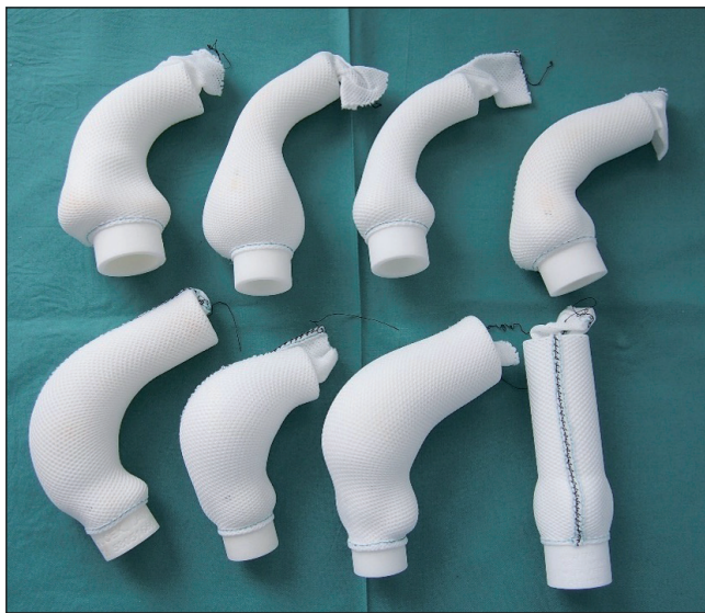
Obr. 1 – Individuálně vyrobené PEARS

Jednou ze základních charakteristik geneticky asociovaných aortopatií je dilatace kořene a/nebo ascendentní aorty. Její progresse může dospět ke katastrofické události, kterou je akutní disekce. Za zlatý standard léčby byla dlouho považována náhrada dilatované části aorty a aortální chlopně konduitem s mechanickou chlopní. Komplikace související s přítomností mechanické chlopně vedly ke snaze najít jiný typ výkonu, a tak by dnes metodou volby měla být zachovná operace, při které bude odstraněna patologická aortální stěna, ale zachována správně fungující aortální chlopeň. Tento typ operace je však technicky poměrně náročný, proto zatím nedoznal univerzálního rozšíření. Další cestou bylo hledání méně rizikové meto-